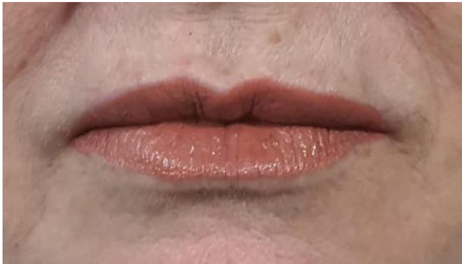
Figura 6. Aspecto dos lábios após 30 dias da 1ª sessão.

O caso foi concluído com a suave projeção labial mantendo aparência natural ( Figura 7 ).