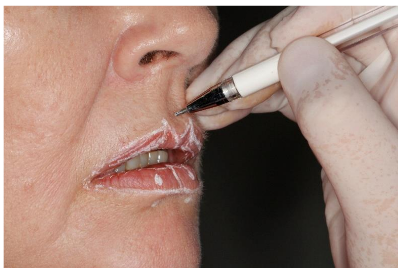
Figura 2. Planejamento usando desenho sobre os lábios.