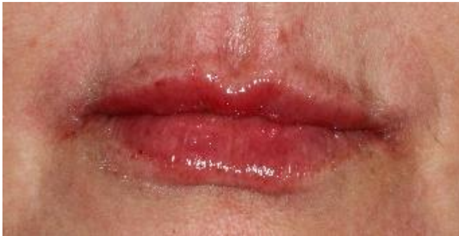
Figura 5. Aspecto final dos lábios logo após a finalização da primeira sessão.

Após conclusão do procedimento ( Figura 5 ), massagem suave no local foi realizada para modelar melhor o preenchedor dentro dos tecidos, fornecendo um contorno mais uniforme.