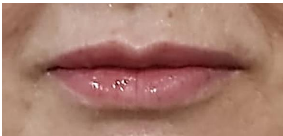
Figura 7. Aspecto final dos lábios logo após a finalização da segunda sessão, foi injetado mais 1mL de preenchedor.