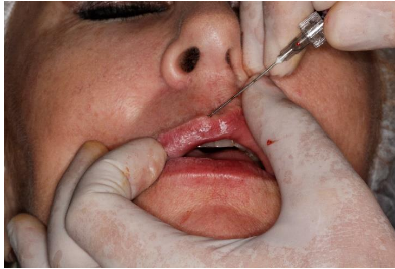
Figura 4 - Inserção da cânula para preenchimento do lábio superior.

O contorno labial foi realizado na técnica de retroinjeção, com aplicação superficial em todo o contorno labial. A eversão na comissura labial pode amenizar a aparência de sorriso triste e esta foi obtida fazendo um pilar de ácido hialurônico na extremidade da comissura, colocando uma média de 0,1 ml em cada lado.