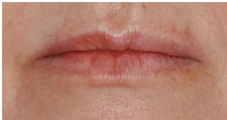
Figura 1. Fotografia inicial do caso com lábios cerrados.

Após antissepsia com digluconato de clorexidina 2% (Riohex 2% - Rioquímica, São José do Rio Preto - SP), as marcações com caneta dermatográfica foram realizadas com a paciente sentada, para não perder a referência natural dos lábios, para auxiliar no planejamento e evitar falhas durante a execução da técnica ( Figura 2 ). Em seguida, a paciente foi submetida a anestesia com lidocaína tópica (Dermomax Creme 40mg - Aché, Guarulhos - SP) e de bloqueio dos nervos infraorbitário e mentoniano com anestésico local injetável a base de cloridrato de lidocaína 2% com epinefrina 1:100.000 (Alphacaína - DFL, Rio de Janeiro - RJ).